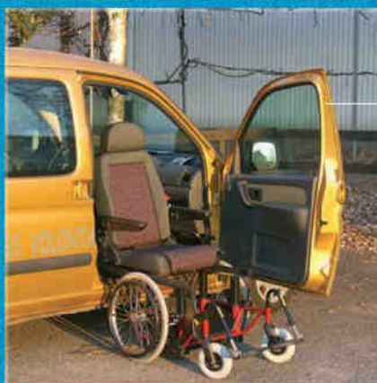
Base girevole + sedile + carrozzina