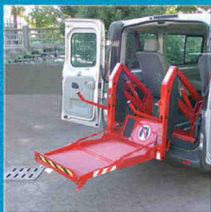
Pedana elettroidraulica a due colonne