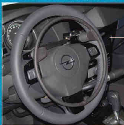
Acceleratore elettronico a cerchietto sopra al volante

Via L. Da Vinci, 1B - Rozzano - 20089 - MI CODICE FISCALE E PARTITA I.V.A. 00700990153 Tel. 02/89200346 - Fax 02/57511330 - www.rodimodifiche.com - info@rodimodifiche.com